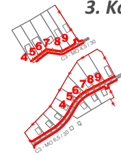
3. Kojatice - Pod cintorínom