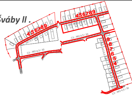
2. Kojatice - Šváby II.