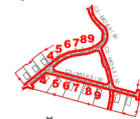
10. Šarišské Lužianky - Juh